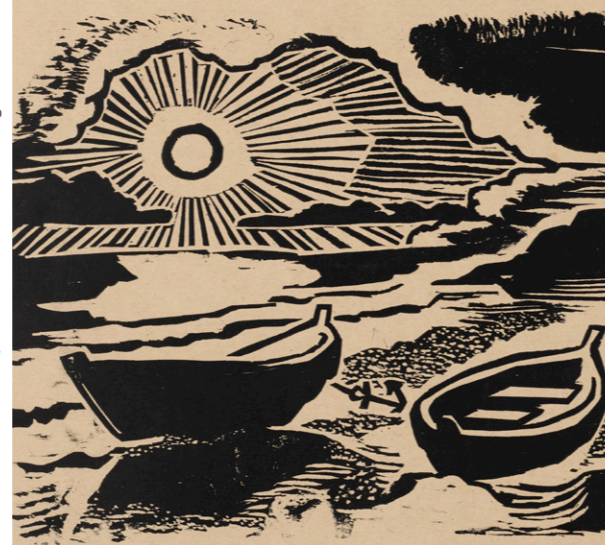
Max Pechstein, Untergehende Sonne (Ostseestrand)/Setting Sun (Baltic Sea Beach), 1948, Kunstsammlungen Zwickau – Max-Pechstein-Museum, © 2023 Pechstein – Hamburg/Berlin

Online Buchung unter: tickets.museum-wiesbaden.de Online booking at: tickets.museum-wiesbaden.de