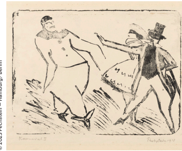
Max Pechstein, Karneval II / Carnival II, 1910, Kunstsammlungen Zwickau – Max Pechstein-Museum, © 2023 Pechstein – Hamburg / Berlin

“I began work. Early in the morning, before dawn, I was already out on the lake in the boat, capturing the sunrises and then fishing.”