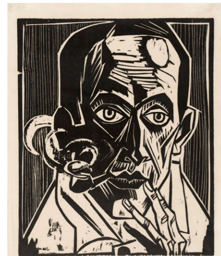
Max Pechstein, Selbstbildnis mit Pfeife / Self-Portrait with Pipe, 1921, Kunstsammlungen Zwickau – Max Pechstein-Museum, © 2023 Pechstein – Hamburg / Berlin