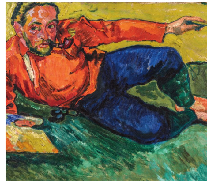
Max Pechstein, Selbstbildnis, liegend / Self-Portrait Reclining, 1909, Privatbesitz © 2023 Pechstein – Hamburg / Berlin

This exhibition, "The Sun in Black and White," poses the questions: Why did an expressive painter, whose primary concern was emotion, voluntarily and not infrequently forgo the subjectivizing effect of colour? To explore the answer to this question, all the artist's major themes – landscape, nude, family, and religion – will be shown in colour and black-and-white works.